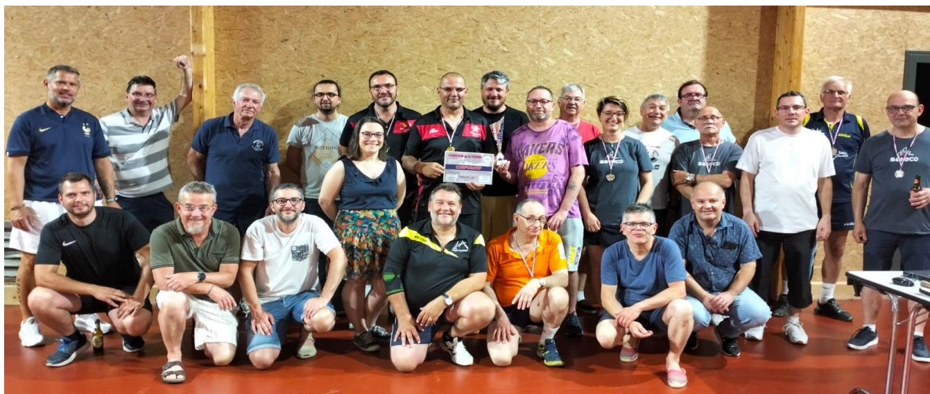
l'ensemble des équipes du championnat corpo !