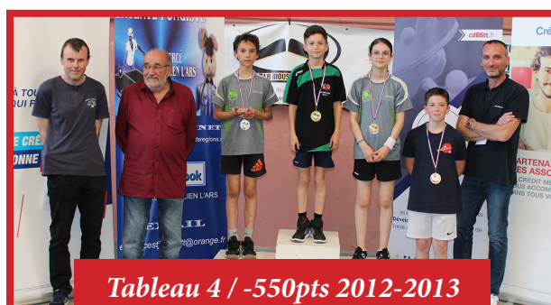
Tableau 4 / -550pts 2012-2013