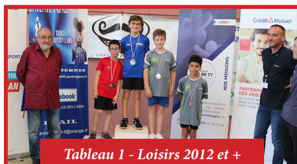
Tableau 1 - Loisirs 2012 et +