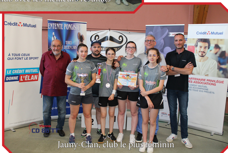
Jauny-Clan, club le plus féminin