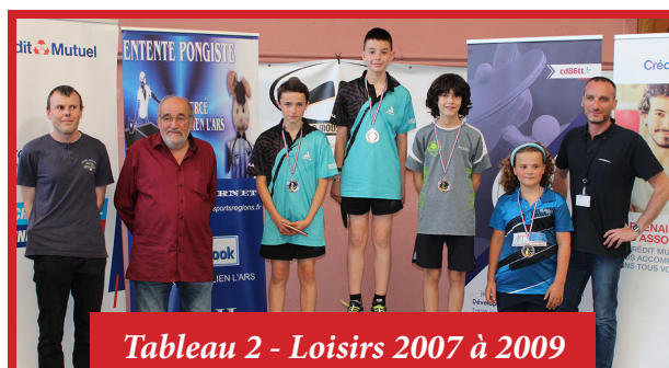
Tableau 2 - Loisirs 2007 à 2009