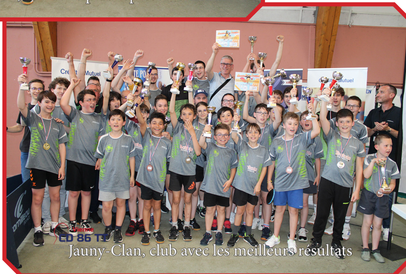
Jauny-Clan, club avec les meilleurs résultats