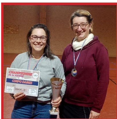
< Podium Simples Dames

Mention spéciale au club de la SATECO qui eux aussi sont présent à QUATRE mais les résultats moindre : BRAVO ! La soirée s'est bien sur terminée autour du verre de l'amitié !