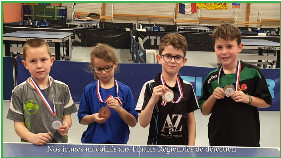
Nos jeunes médaillés aux Finales Régionales de détection