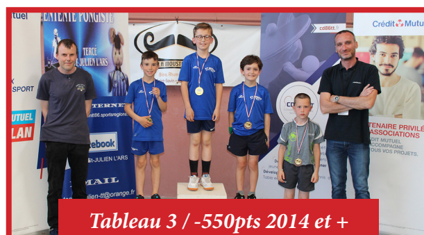
Tableau 3 / -550pts 2014 et +