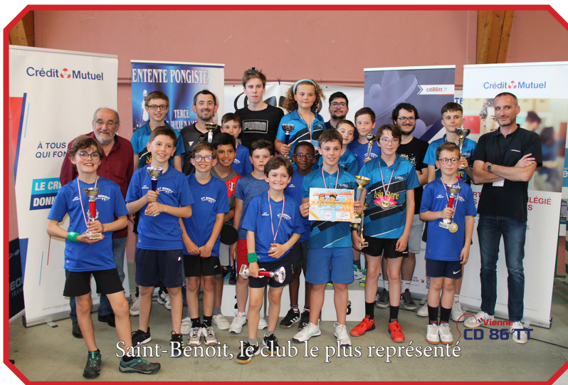
Saint-Benoit, le club le plus représenté