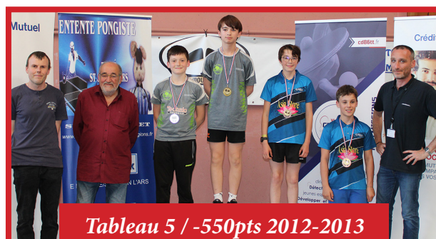
Tableau 5 / -550pts 2012-2013