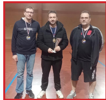
Podium Simples Messieurs >