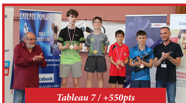
Tableau 7 / +550pts