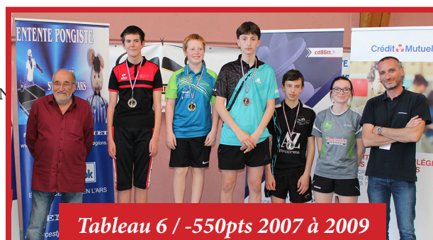
Tableau 6 / -550pts 2007 à 2009